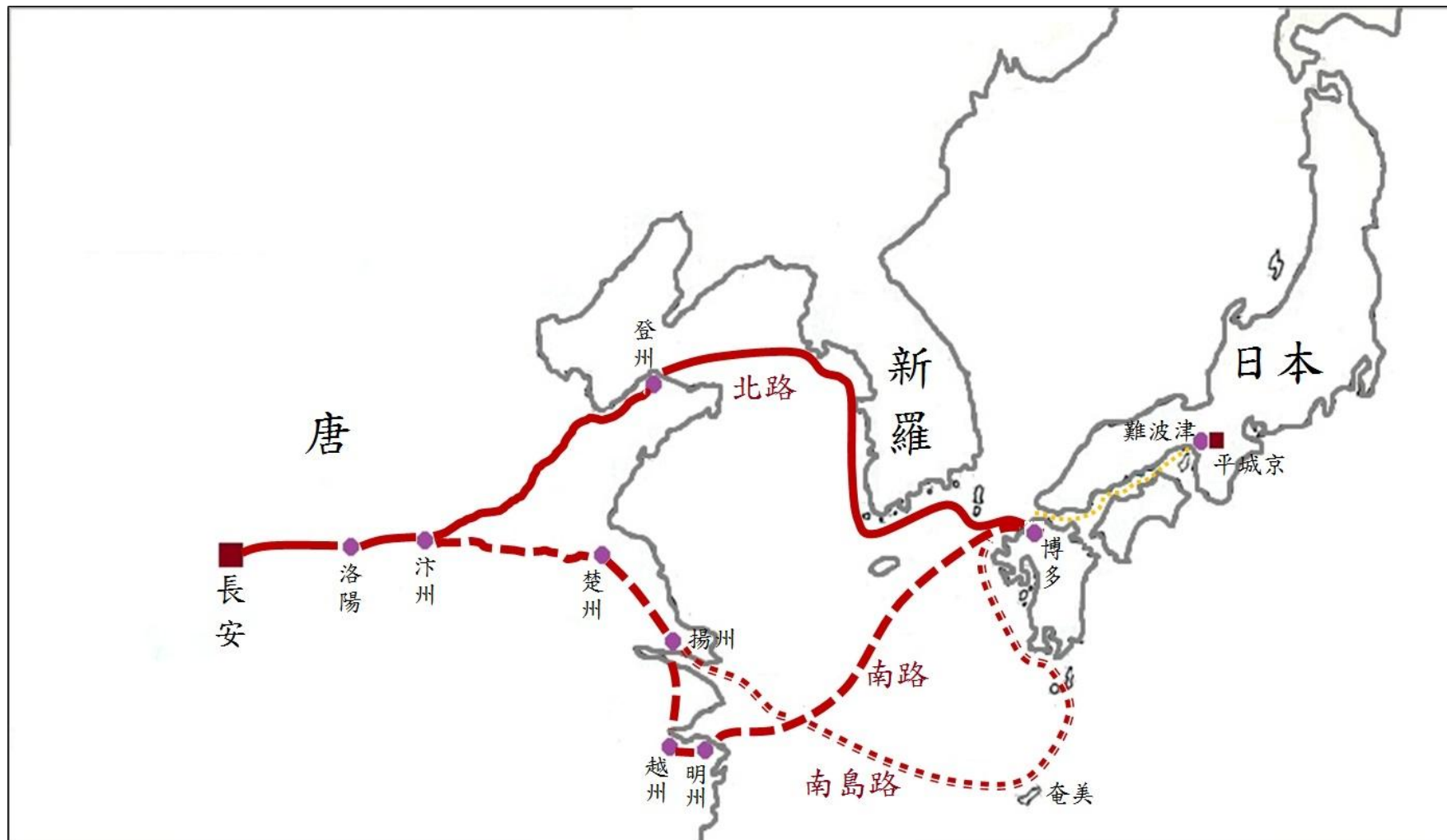
日本遣唐使入唐路線