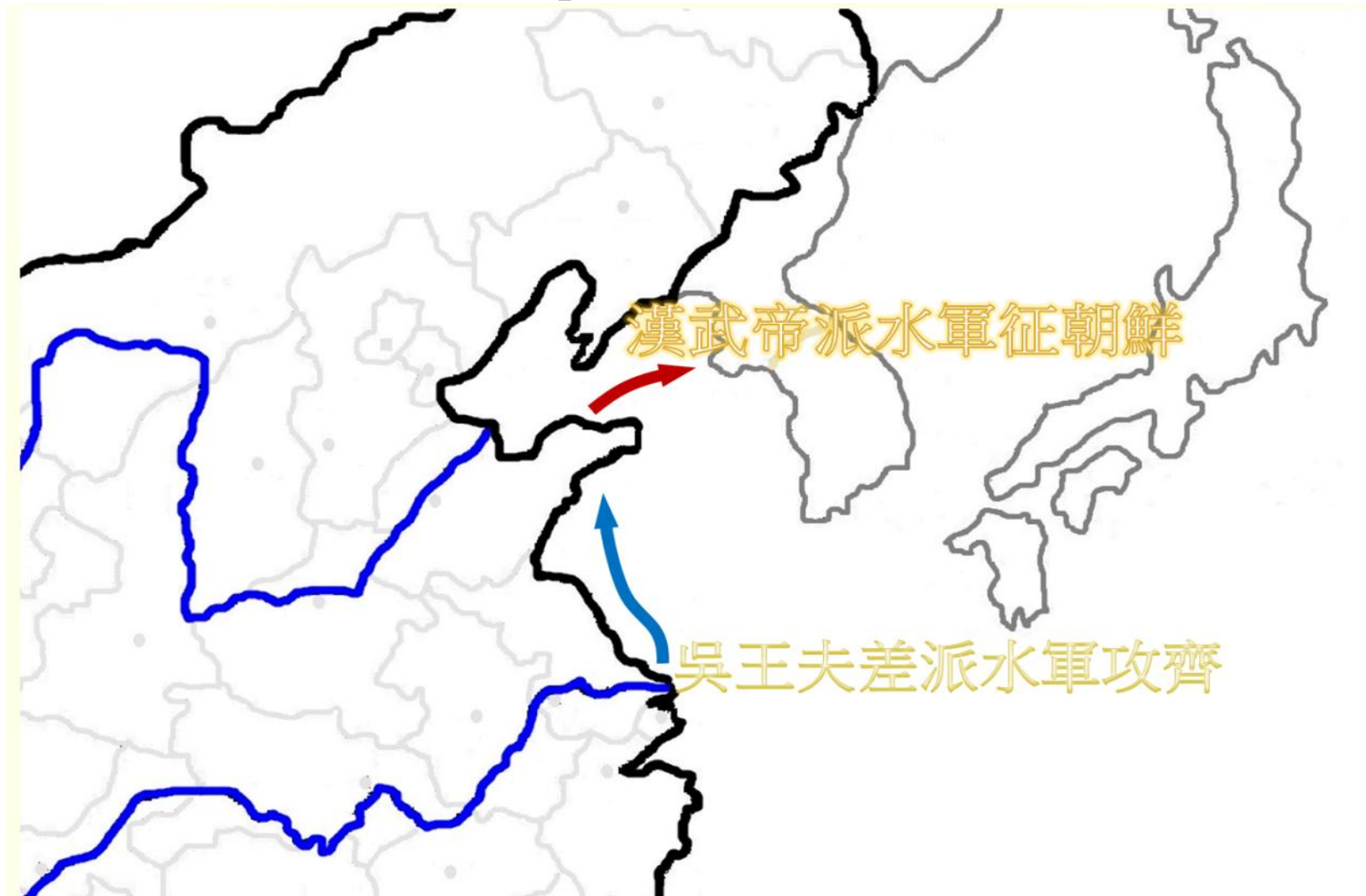
【F1P3T1_中國古代最早兩次渡海作戰】