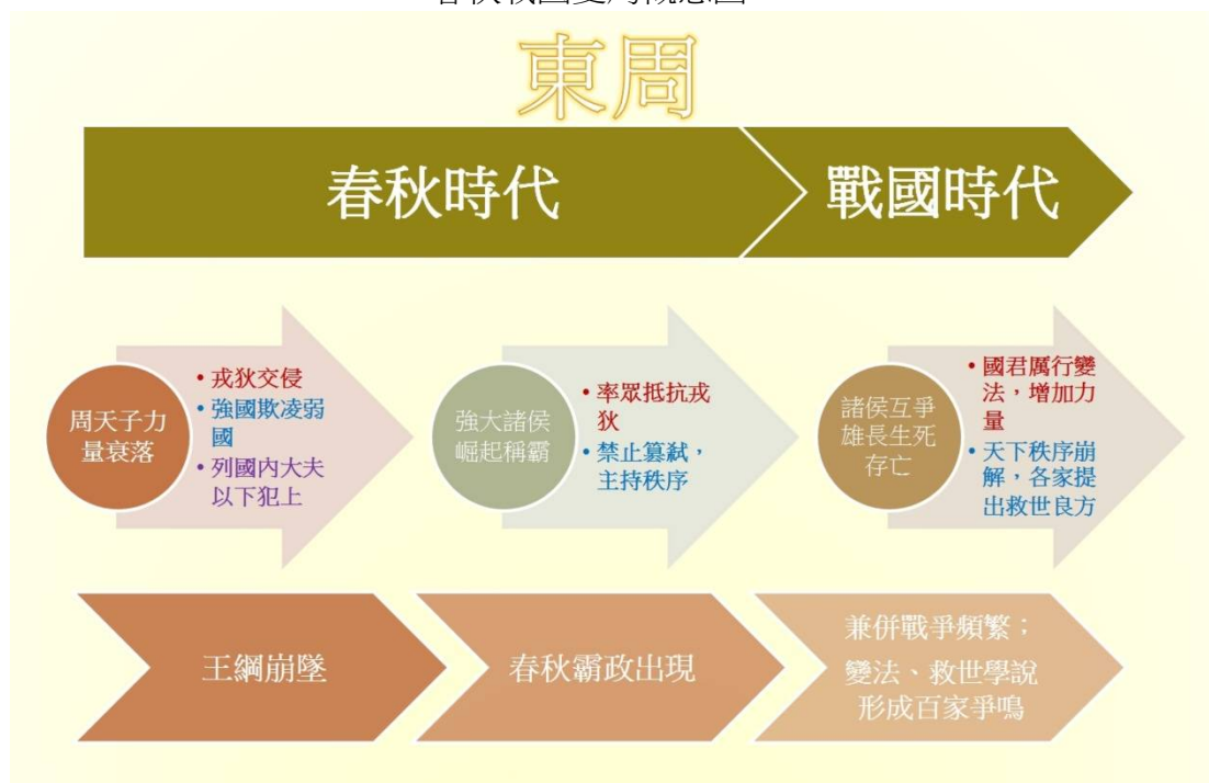
春秋戰國變局概念圖