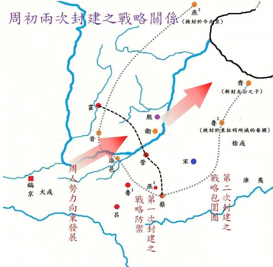
周初兩次封建之戰略關係