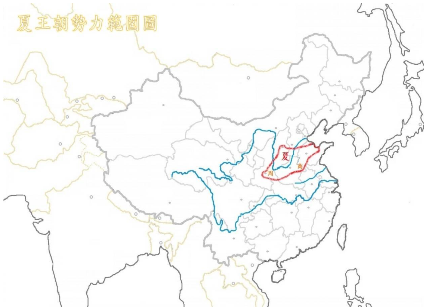
夏王朝勢力範圍圖